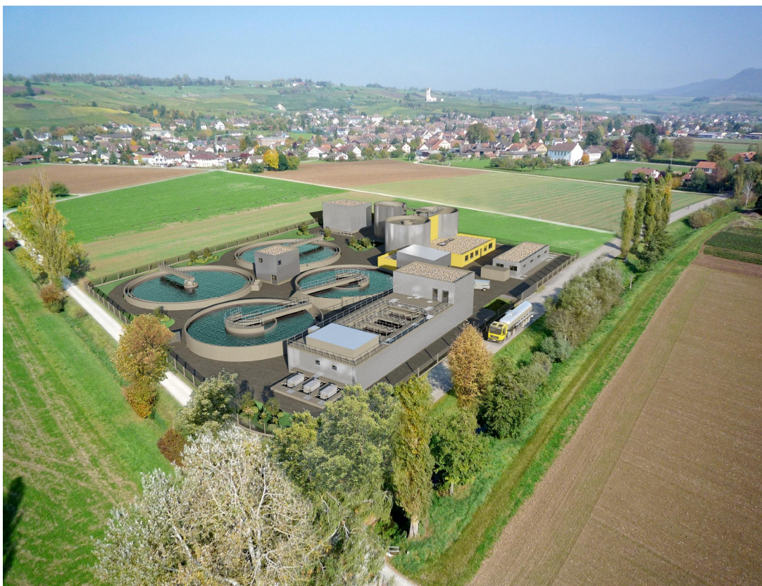
Visualisierung der geplanten Abwasserreinigungsanlage